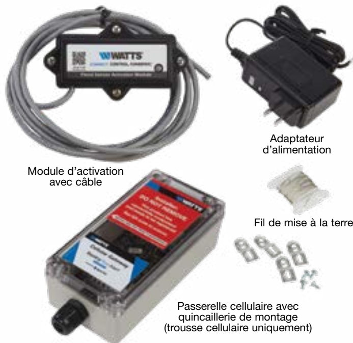
Module d'activation avec câble